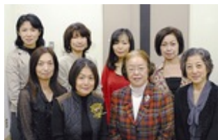
各協力医療機関で活躍する調査員

■(問) 神奈川ユニットセンター事務局【電話】045・782・2770(平日午前9時～午後5時)